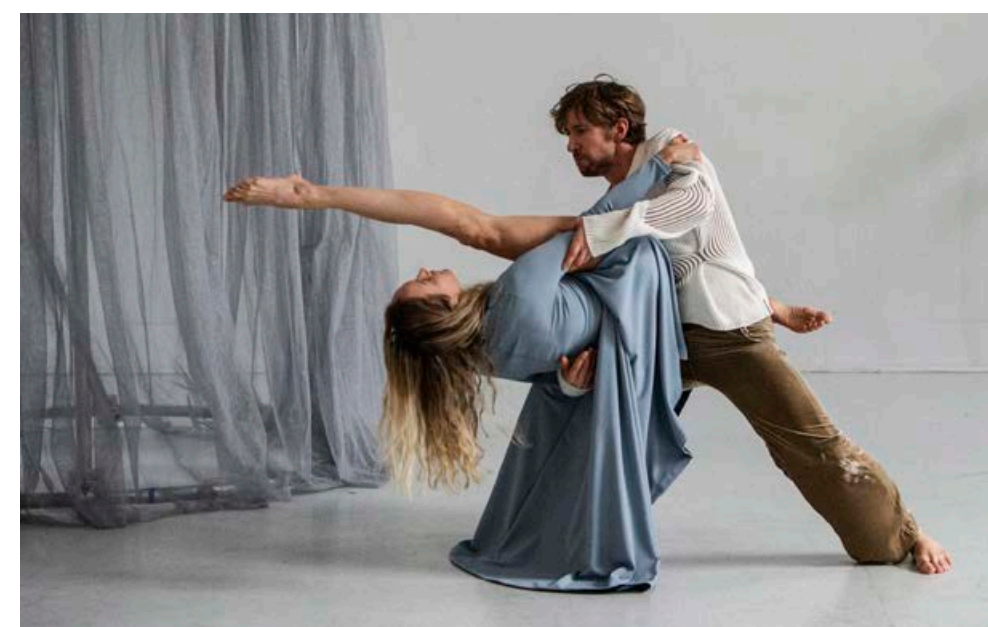
SEVEN DUETS av Ingun Bjørnsgård Projekt. Co-produsert av Bærum Kulturhus. Urpremiere 11. mars i Bærum Kulturhus.