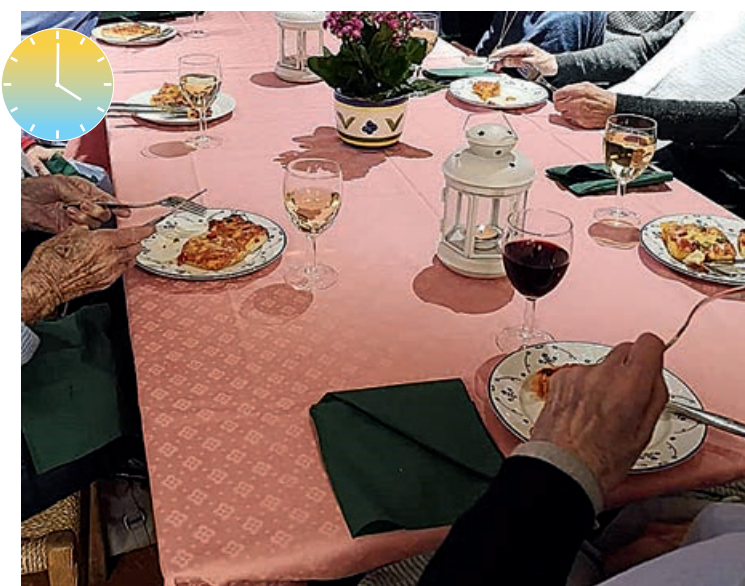
MIDDAG serveres kl. 16 på sykehjemmene i Bærum. På fredager står i blant pizza på menyen på Eikstunet.