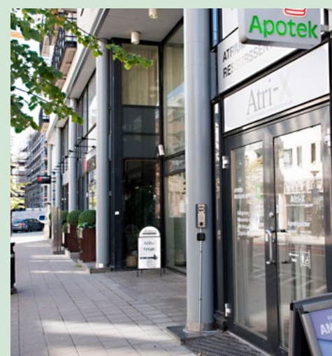
Atri-X, kommunens visningscenter for velferdsteknologi, åpner dørene igjen fra 1. oktober.

gjerrig på frihet- og velferdsteknologi? Ta turen innom Atri-X, oppfordrer han.