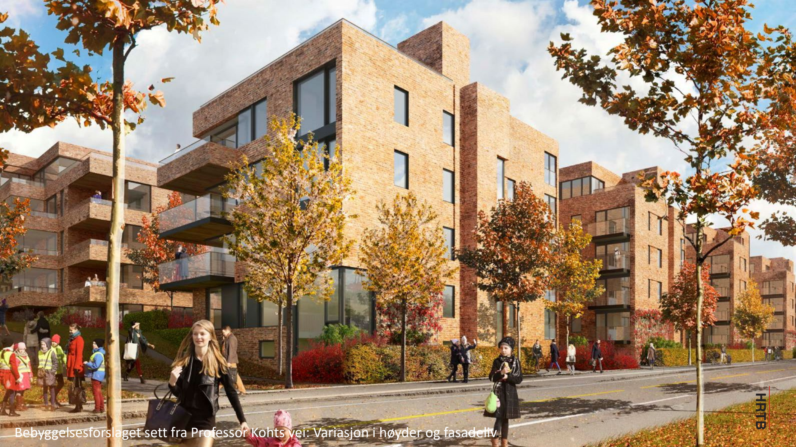
Bebyggelsesforslaget sett fra Professor Kohts vei. Variasjon i høyder og fasadettv.