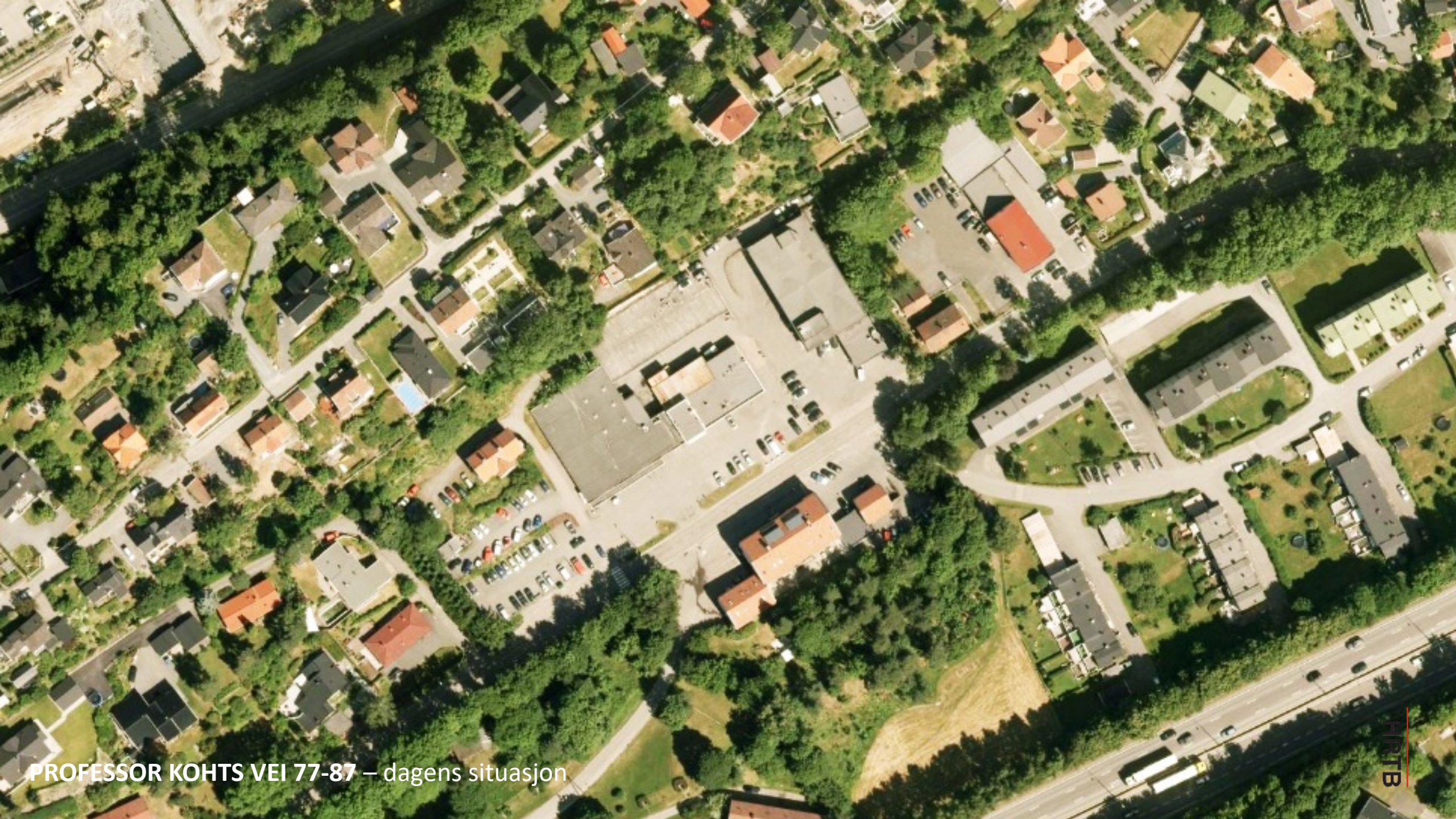
PROFESSOR KOHTS VEI 77-87 – dagens situasjon