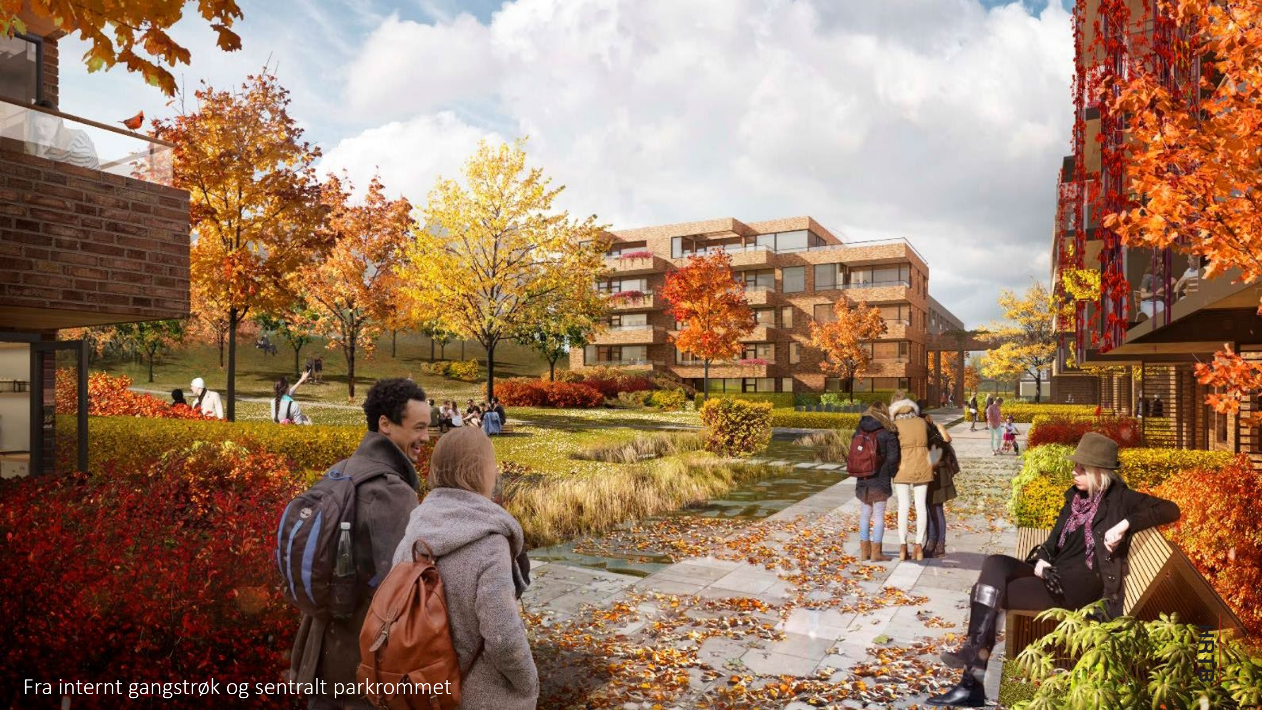
Fra internt gangstrøk og sentralt parkrommet