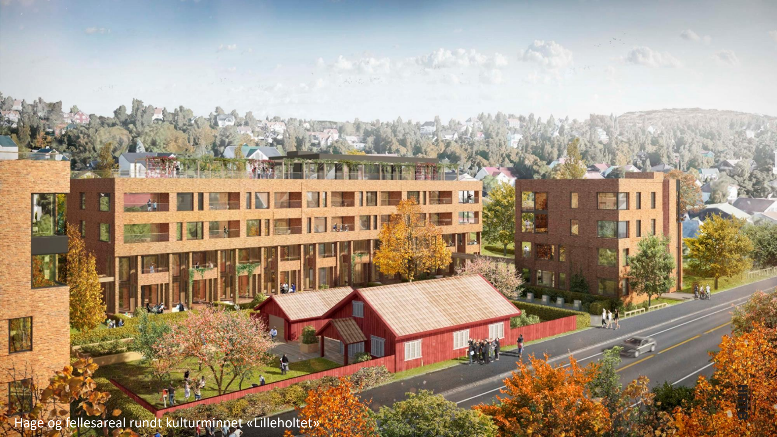
Hage og fellesareal rundt kulturminnet «Lilleholtet»