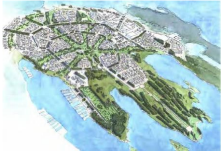
Idé- og konseptfase