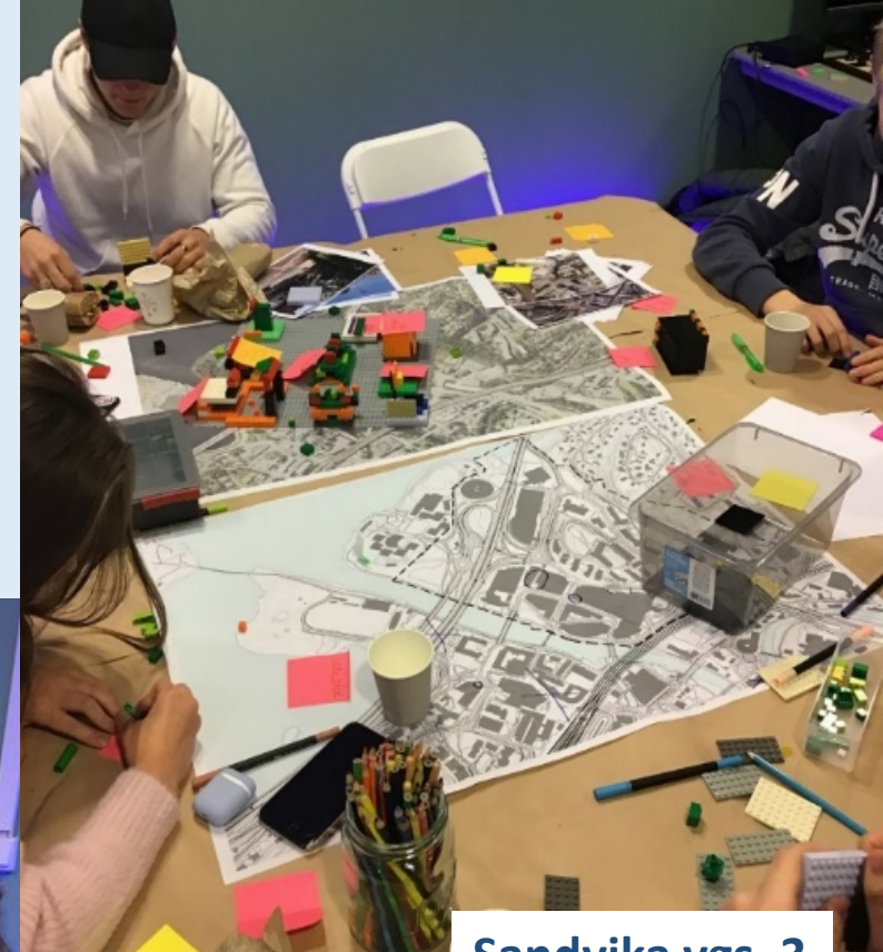
Sandvika vgs. 3