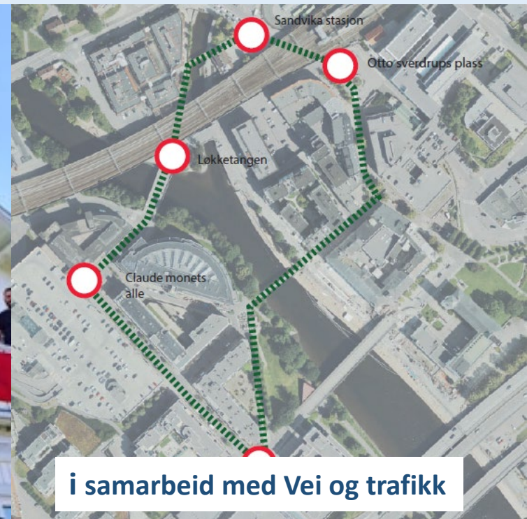
i samarbeid med Vei og trafikk