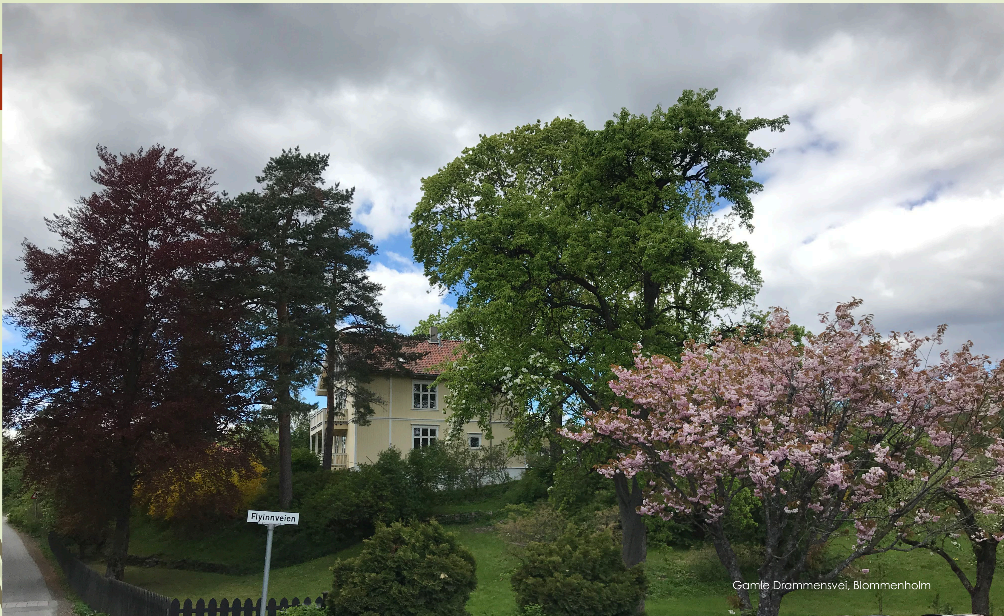
Gamle Drammensvei, Blommenholm