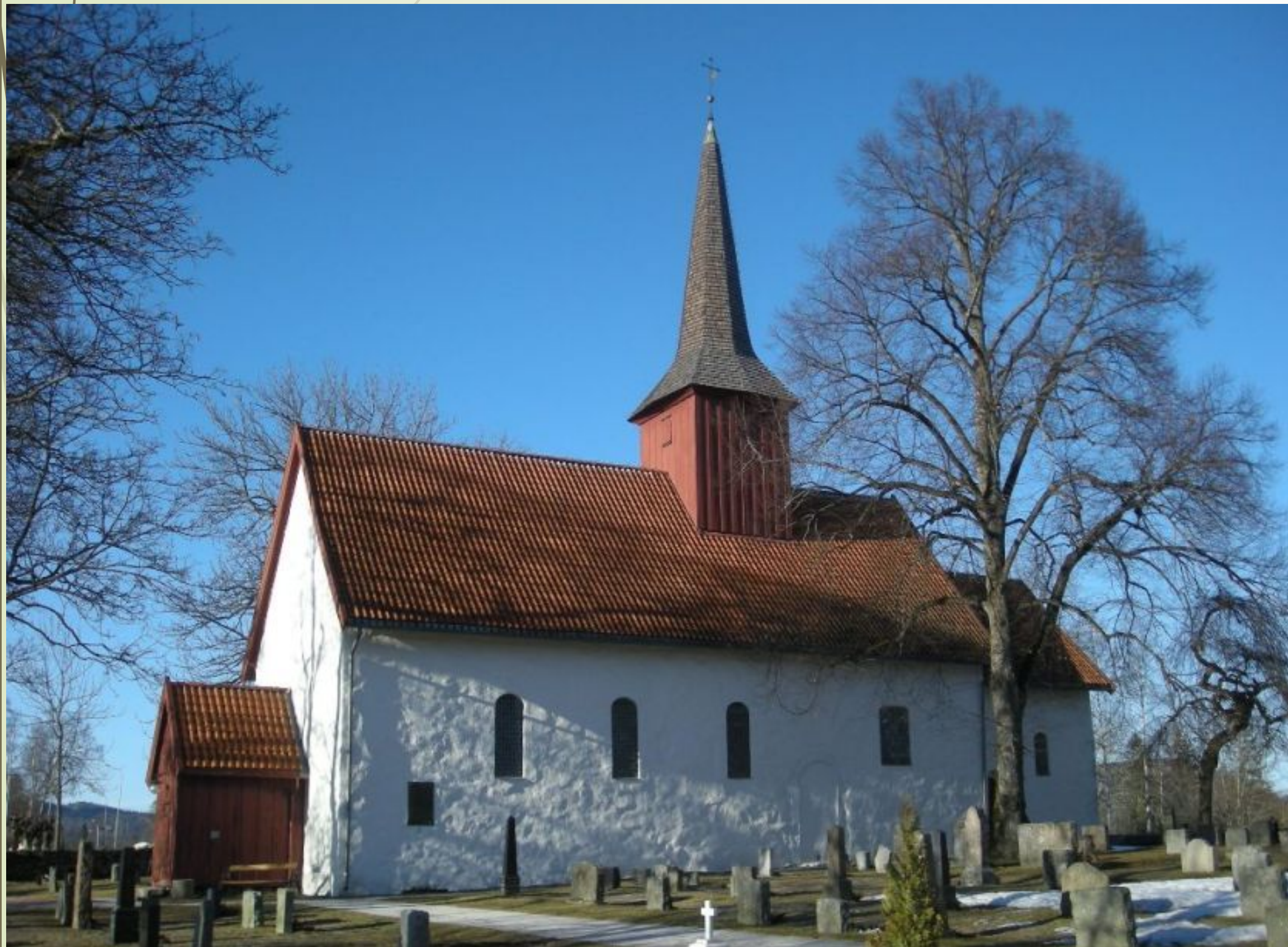
Tanum kirke. Fredet, Kulturminneloven