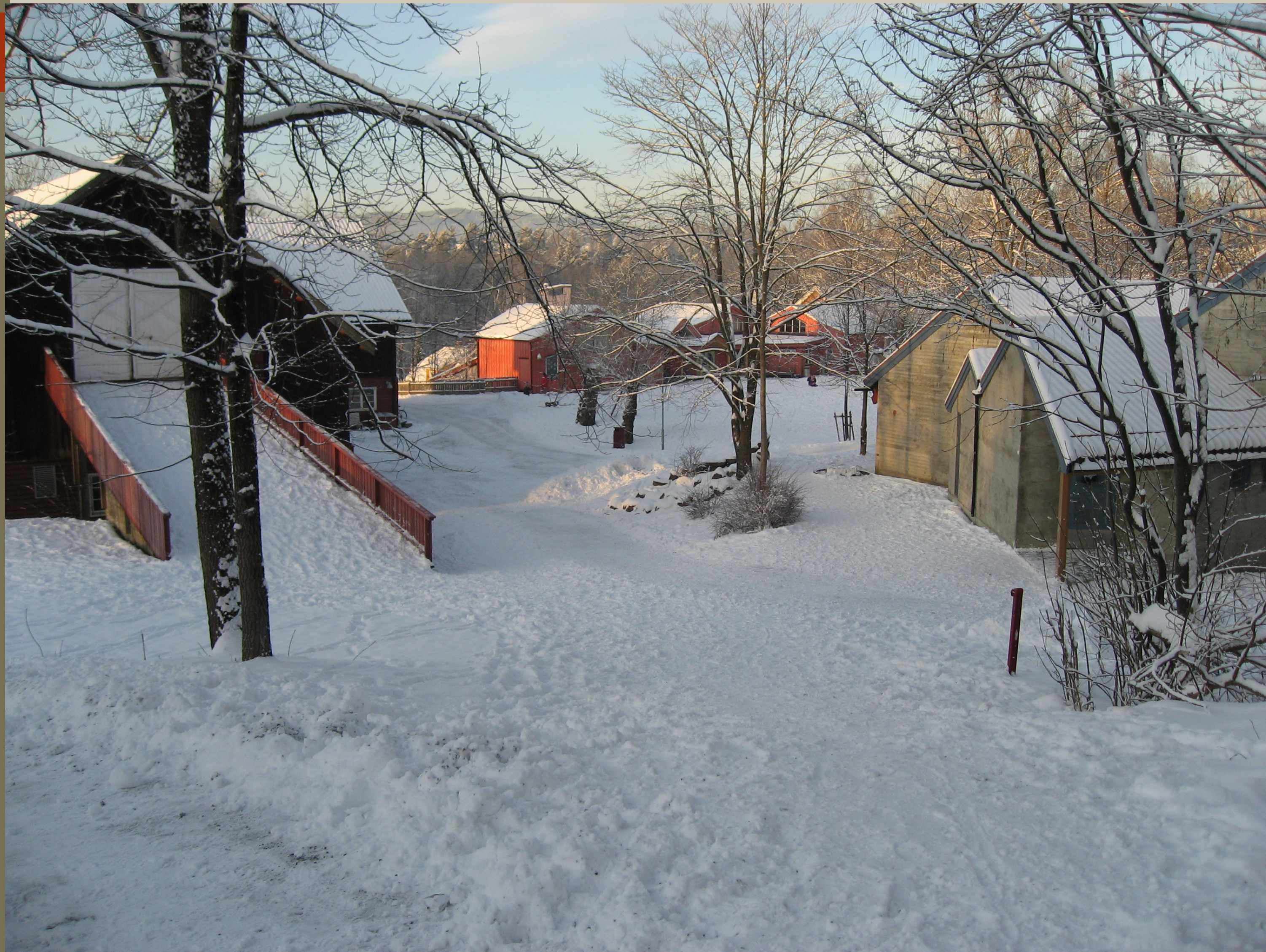
Steinerskolen på Grav