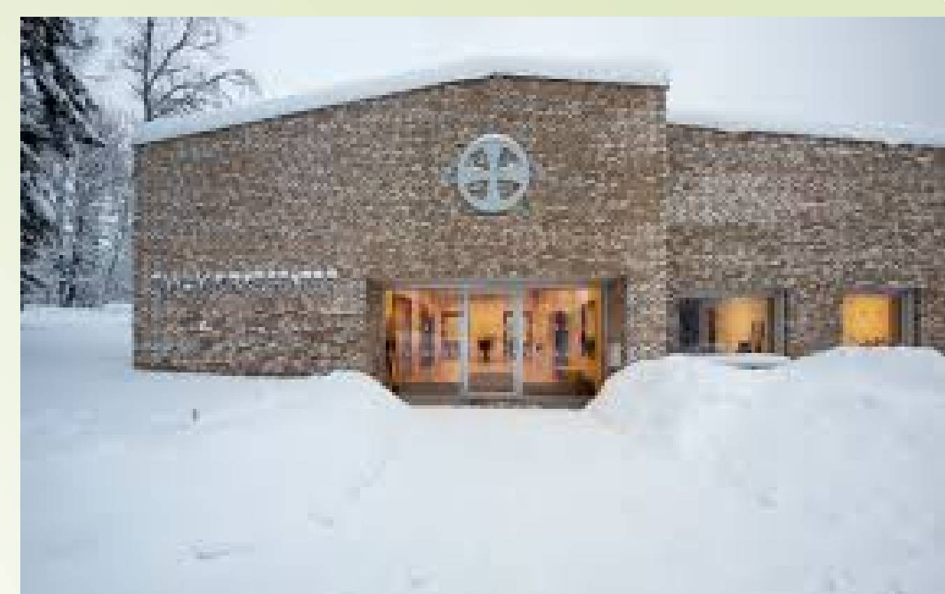
Tanum kirke, ca 1130. Tanum kirkekebygg 2017