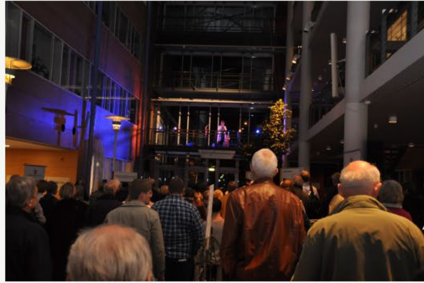
Kraftsamling for flyktninger