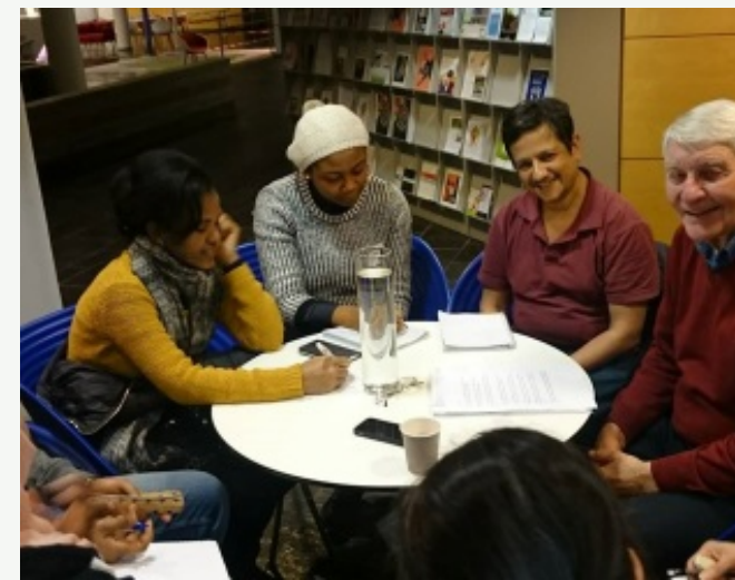
Over 150 nasjonaliteter