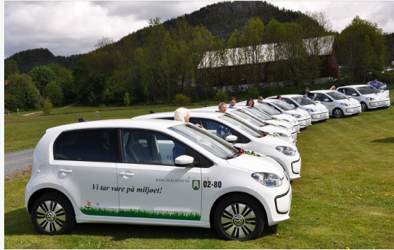
Høy andel elbiler