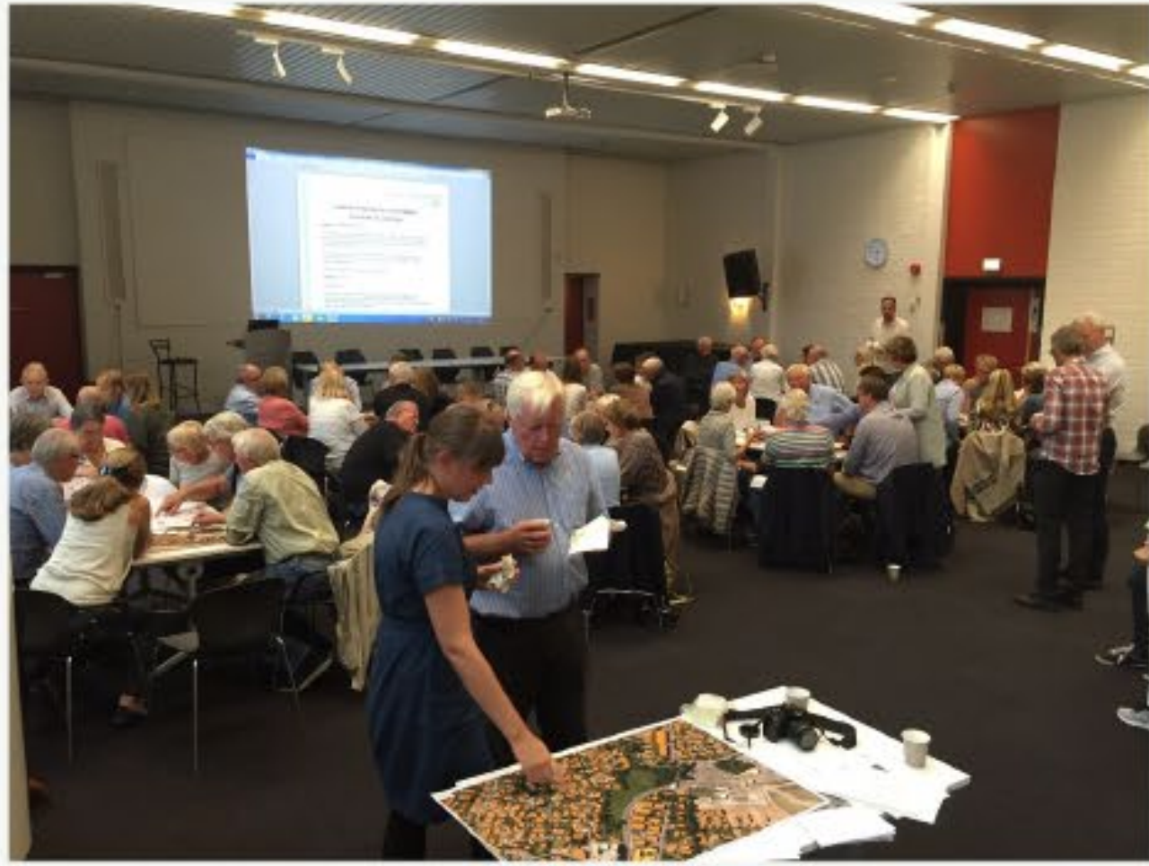
Idemøte Bekkestua sør