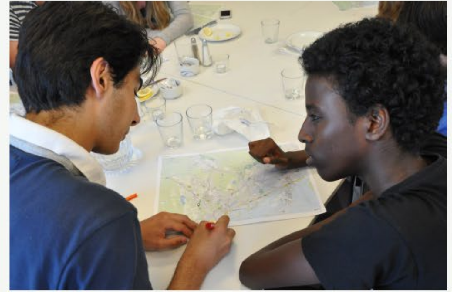
Idemøte mellom UKS og Ruter