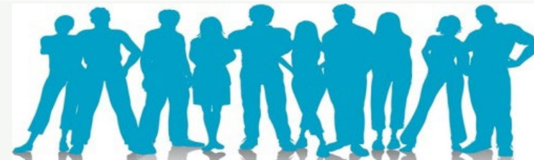
Norges 5. største kommune