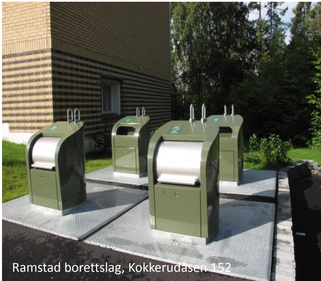
Ramstad borettslag, Kokkerudåsen 152