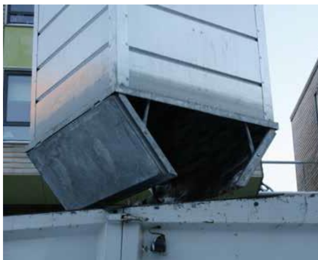
Forurensning og renovasjon