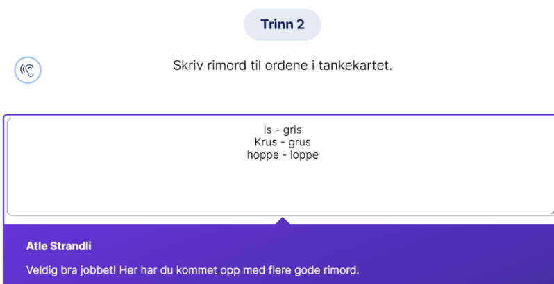
Bilde av elevens arbeid og kommentar fra lærer