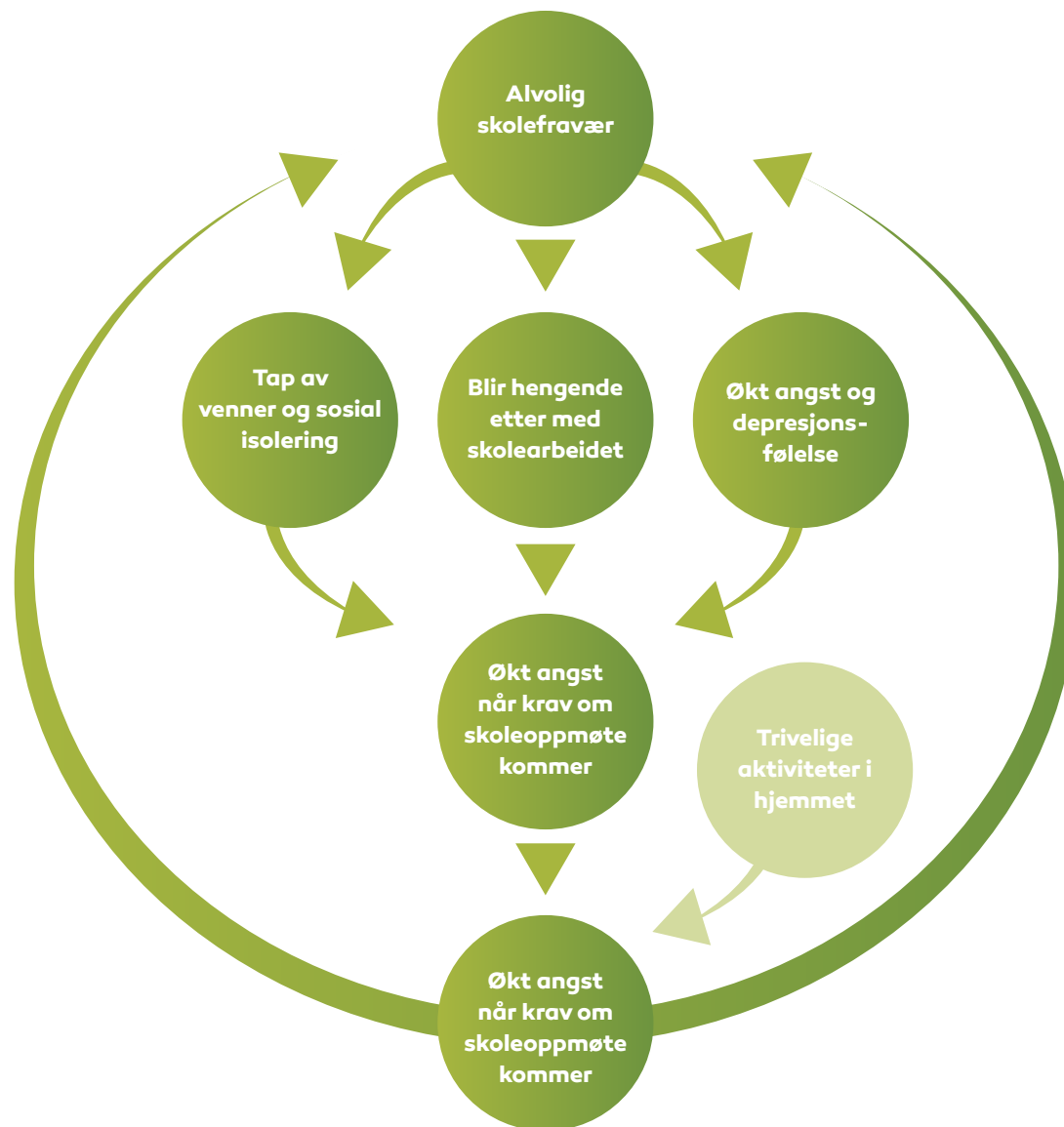
Den onde sirkelen ved alvorlig skolefraværproblematikk (Basert på Oslo Kommune, 2009).

Fraværet i seg selv er også en forsterkende faktor. Jo lenger du blir borte fra skolen, jo verre er det å komme tilbake. Når en er borte over tid, faller utenfor den sosiale tilhørigheten i klassen og på skolen. I tillegg mister eleven mer og mer kontakt med nære venner. Skolearbeidet blir ikke gjort, og eleven kan oppleve en rekke negative bekreftelser på egen utilstrekkelighet.